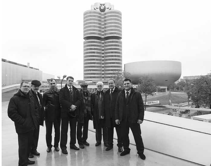
Центральный офис BMW

Самое интересное, что при крайне низком уровне исследований у нас в университете количество получаемых патентов в несколько раз