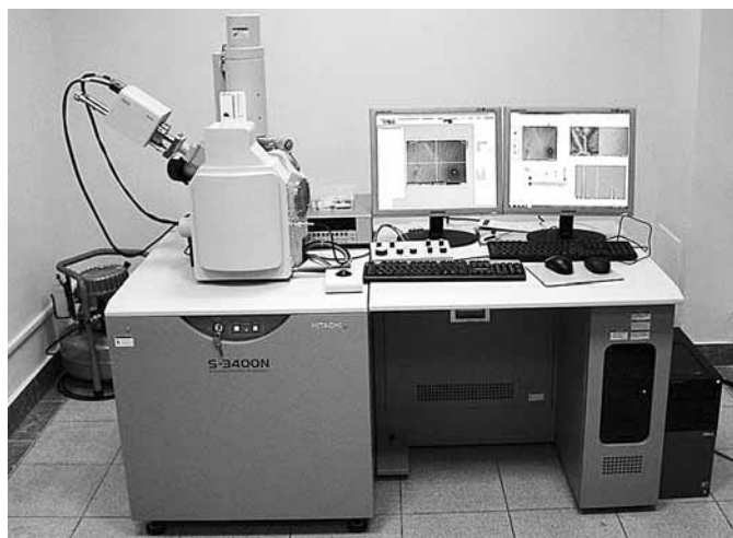
Растровый электронный микроскоп Hitachi S-3400N