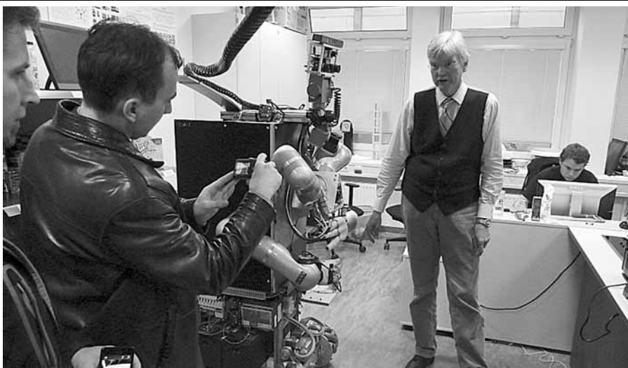
В лаборатории робототехники