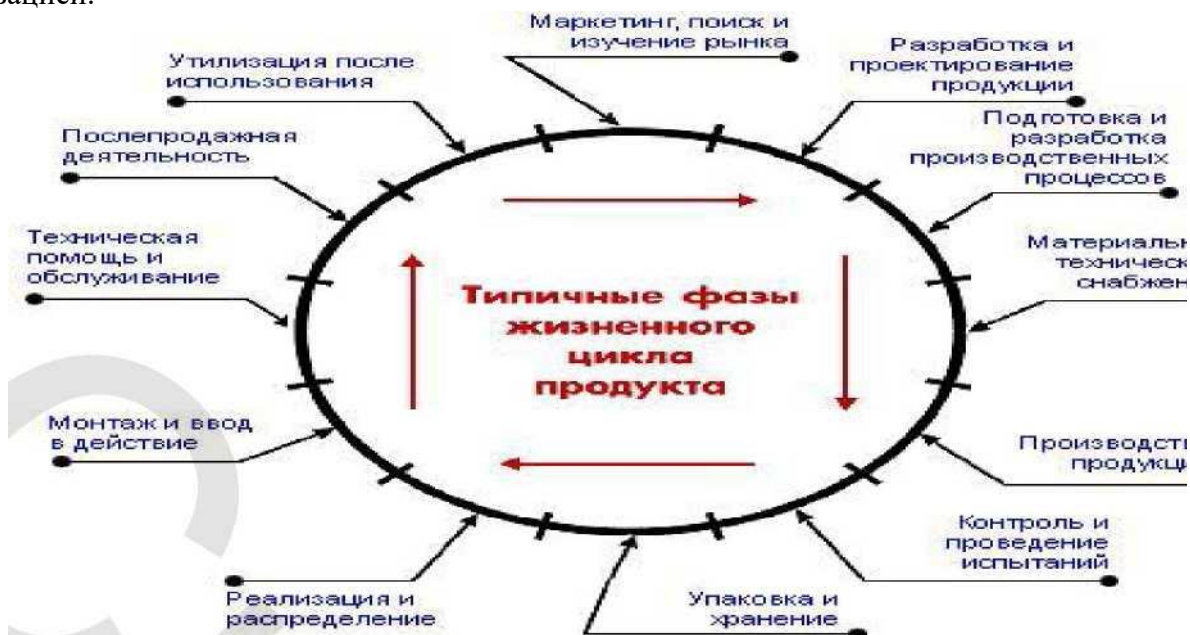
Рис. 2. Типичные фазы жизненного цикла продукции (петля качества)

Пользуясь петлей качества (рис. 2) определить все жизненно важные стадии производства продукции конкретного предприятия, начиная с маркетинга и заканчивая утилизацией.