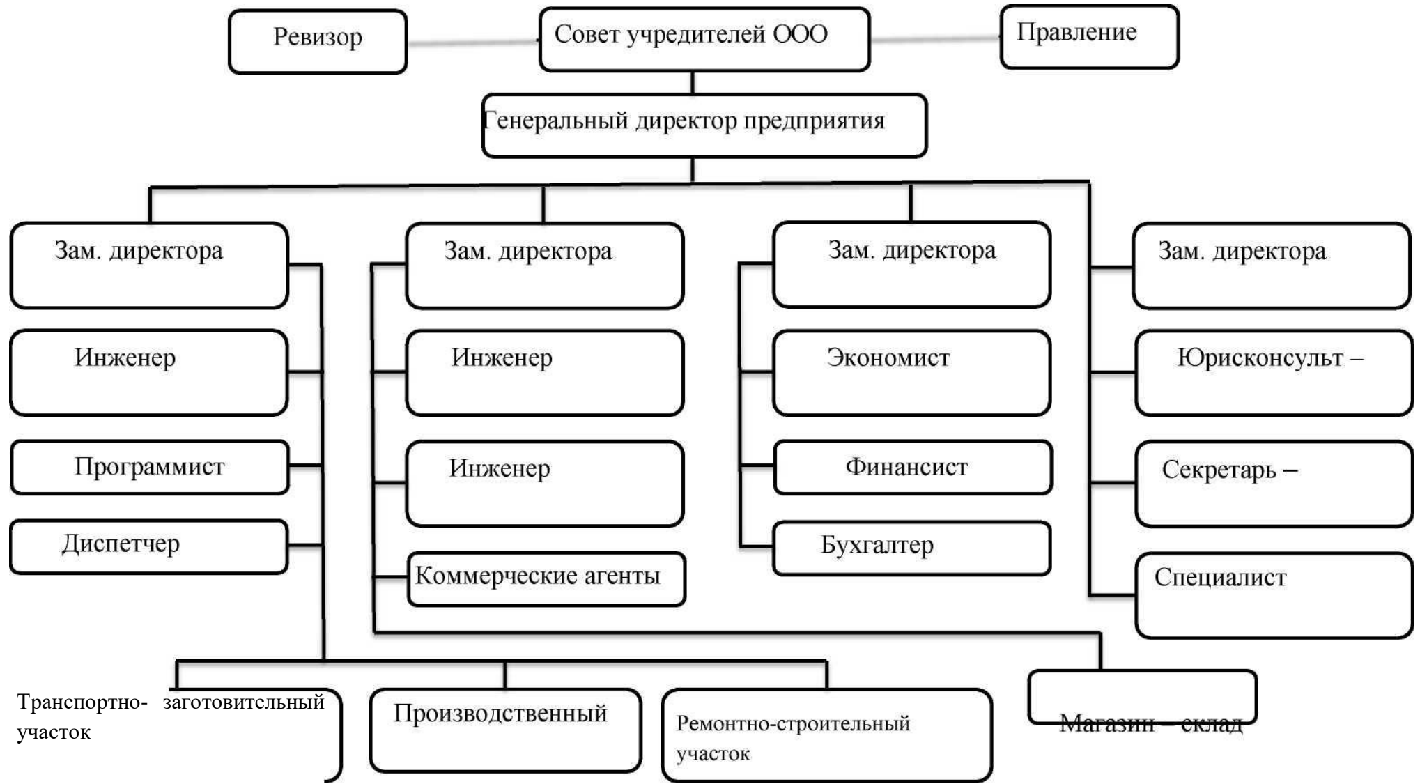
СХЕМА ОРГАНИЗАЦИОННОЙ СТРУКТУРЫ УПРАВЛЕНИЯ ОБЩЕСТВОМ С ОГРАНИЧЕННОЙ ОТВЕТСТВЕННОСТЬЮ