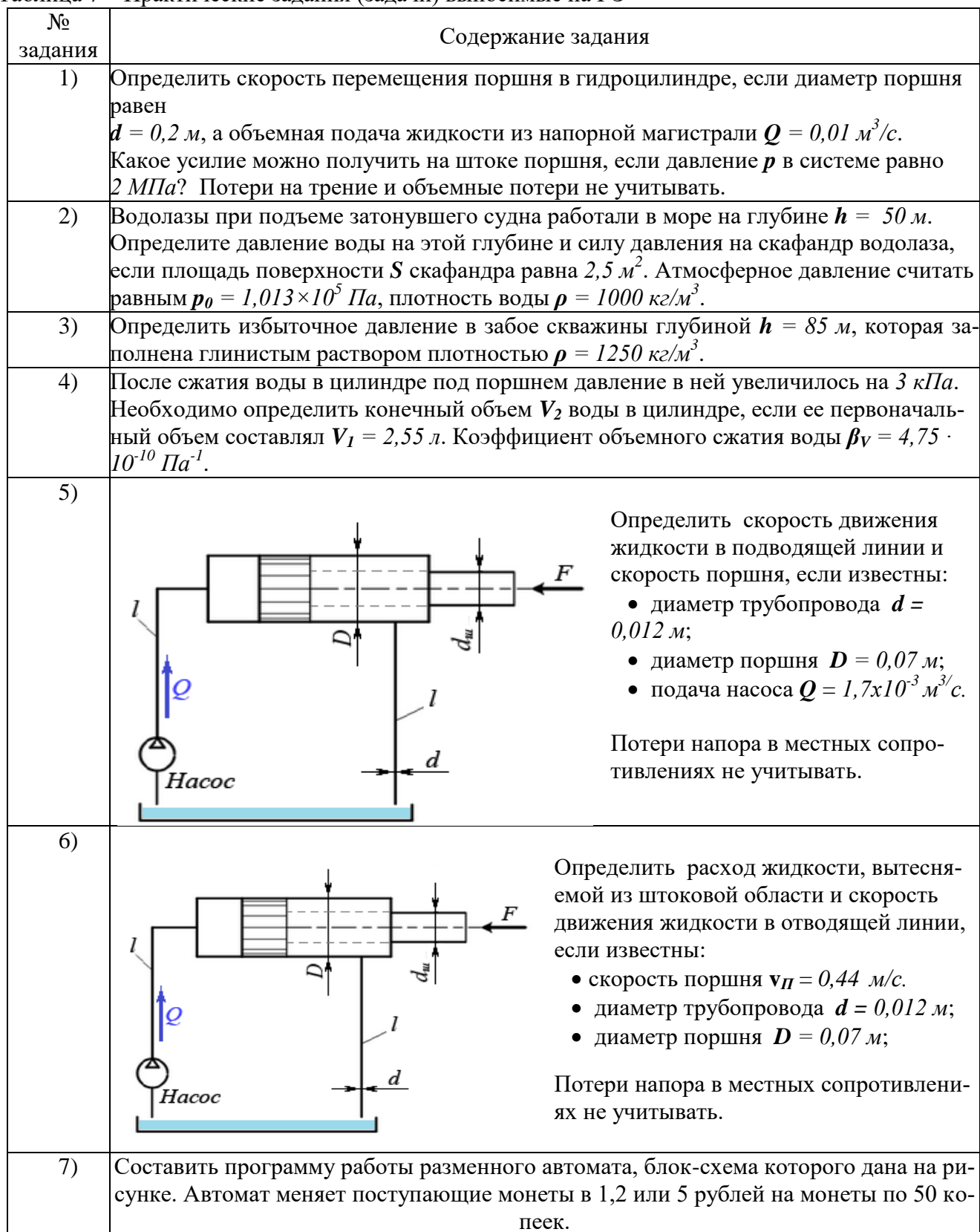
Таблица 7 – Практические задания (задачи) выносимые на ГЭ